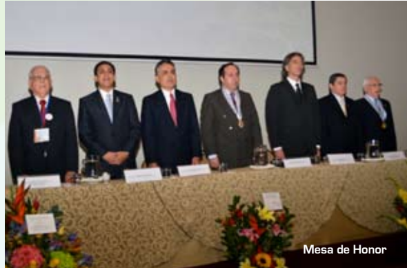
Mesa de Honor