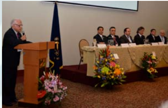
Discurso del Dr. Ramón Castillo (Epónimo del VI Congreso Internacional Sociedad Peruana de Odontopediatría)

Durante la ceremonia se entregó el premio a los mejores alumnos en el curso de Odontopediatría de las diferentes universidades del país.