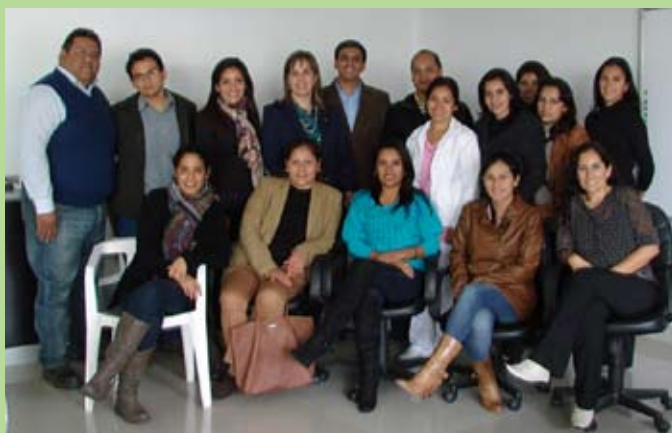
Asistentes al Taller de Terapia Pulpar