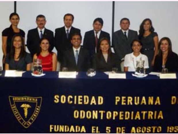
Junta Directiva 2013 - 2015